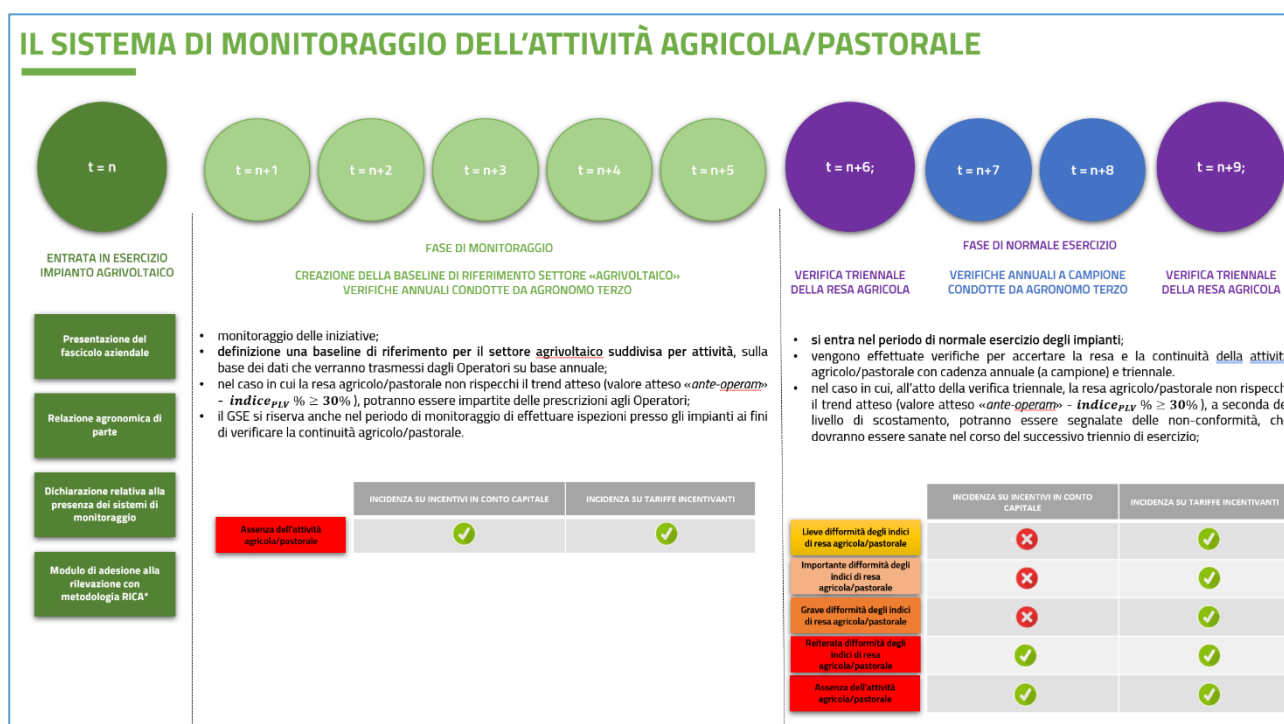
Figura 1 - Il sistema di monitoraggio dell'attività agricola/pastorale